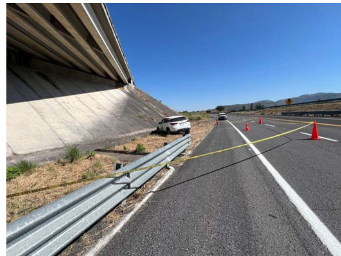
En el Libramiento Norte