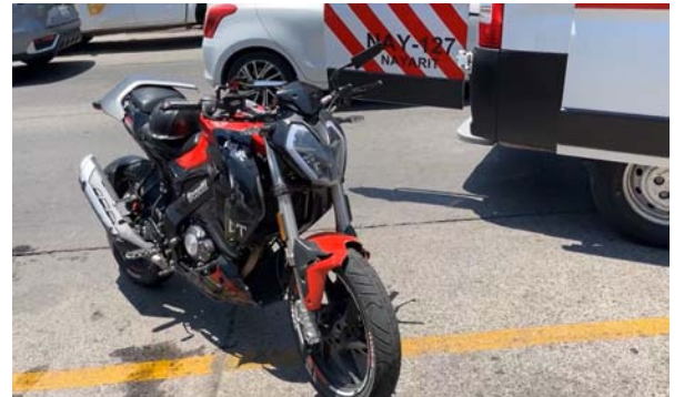
Motociclista en Ciudad Del Valle