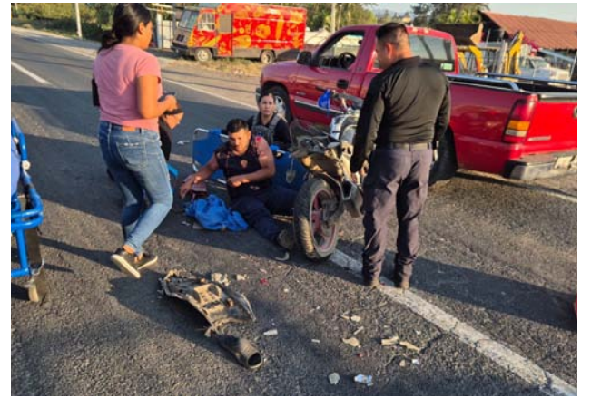
En la carretera a San Cayetano