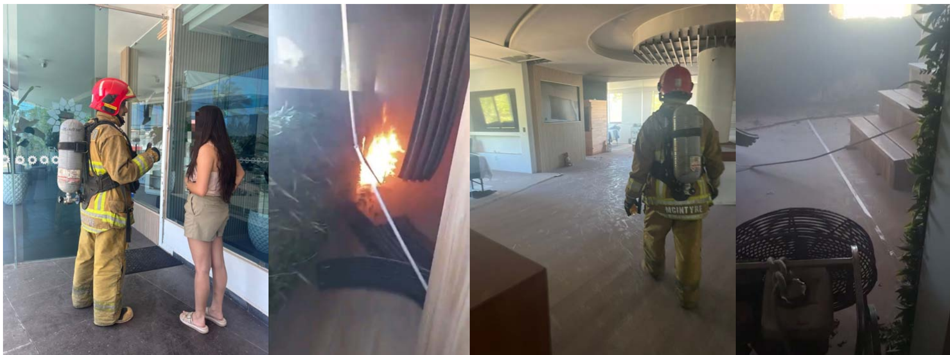
Spa en Bahía de Banderas