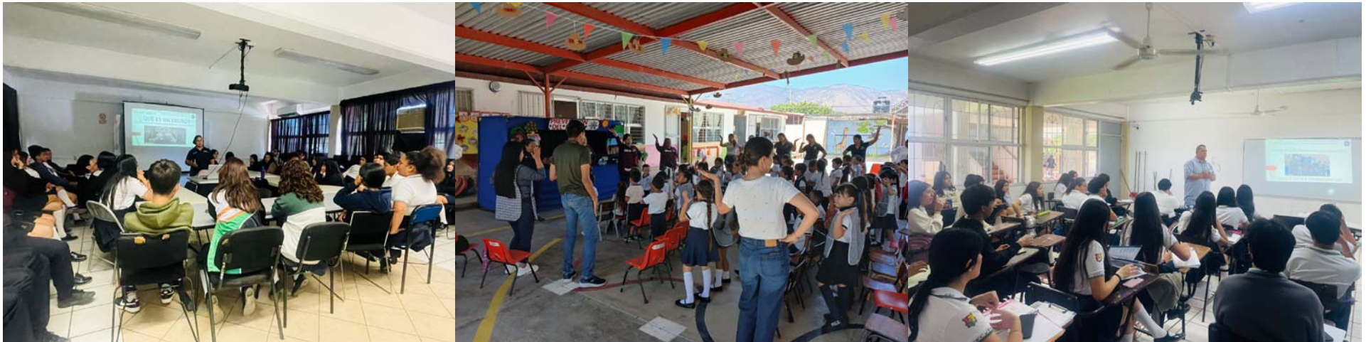
En planteles de Tepic