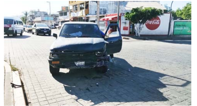
En la colonia Mololoa