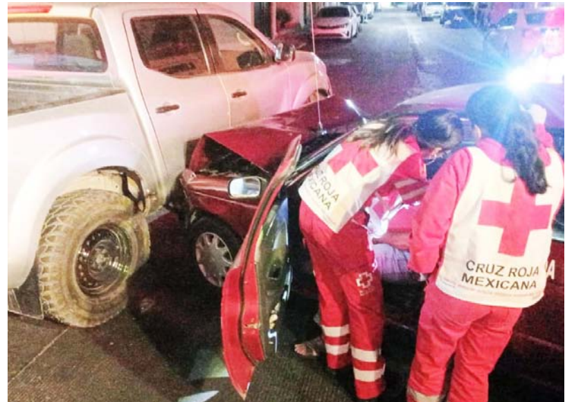
En la colonia Los Fresnos