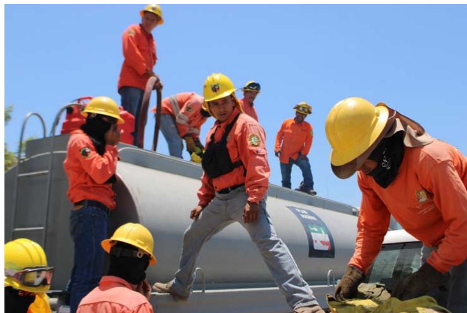
En relleno sanitario en el municipio de San Blas