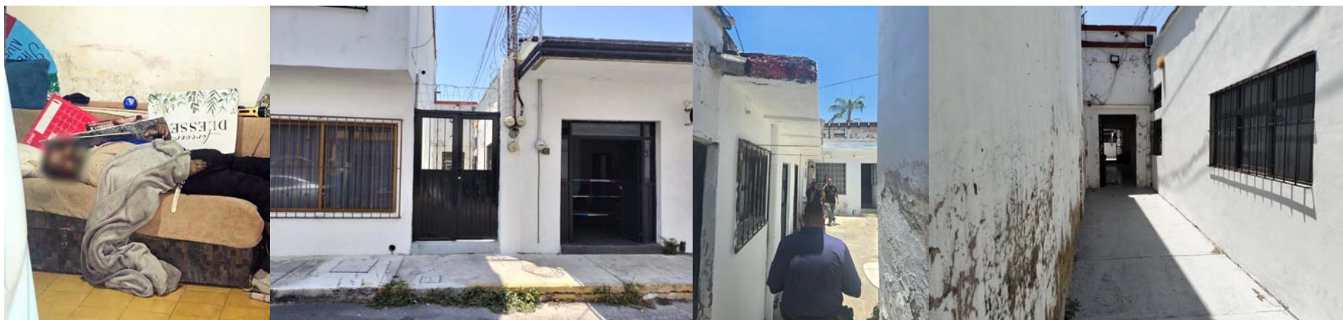
En la colonia San Antonio