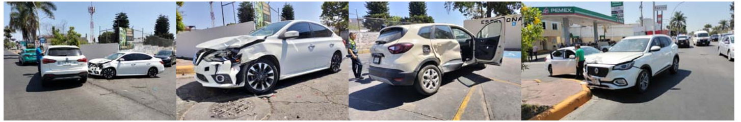
En el bulevar Tepic-Xalisco