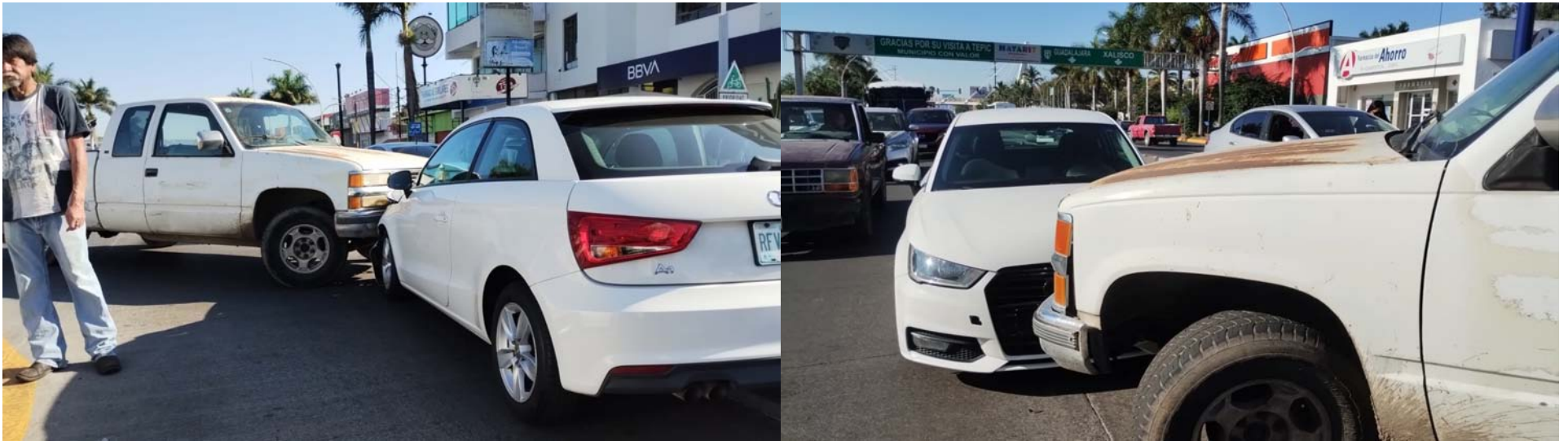
Colapsa el bulevar Tepic-Xalisco