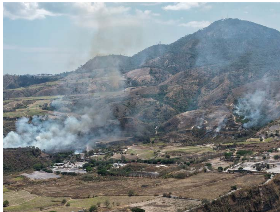
El cerro de San Juan