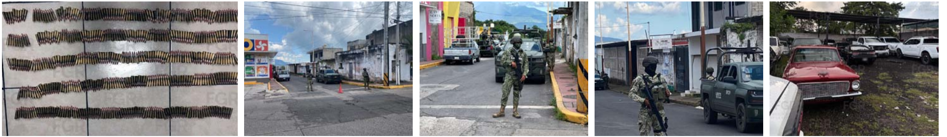
Detenidos con armas en Xalisco