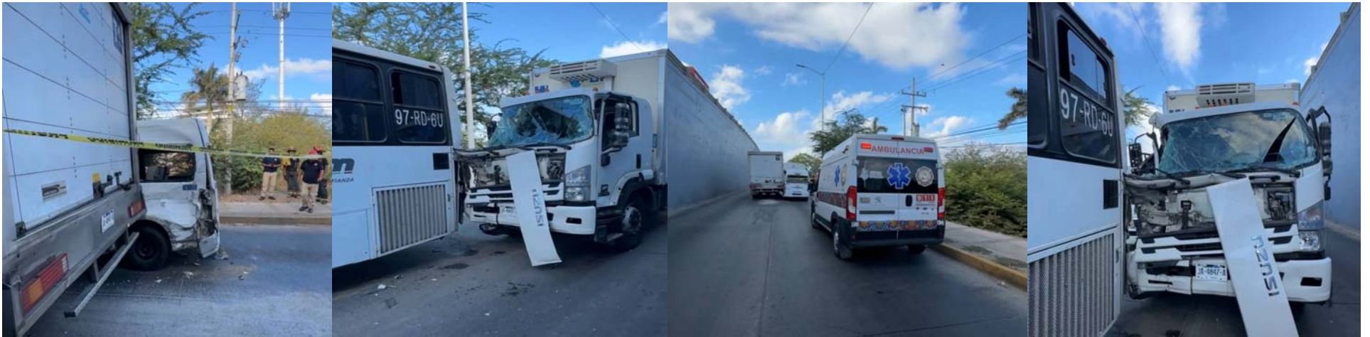
Colapsa el ingreso a Nuevo Nayarit