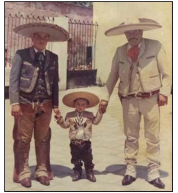
Este Miércoles, en Tepic