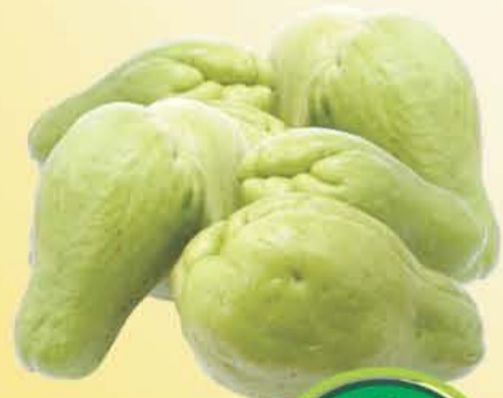
CHAYOTE Sin Espinas kilo