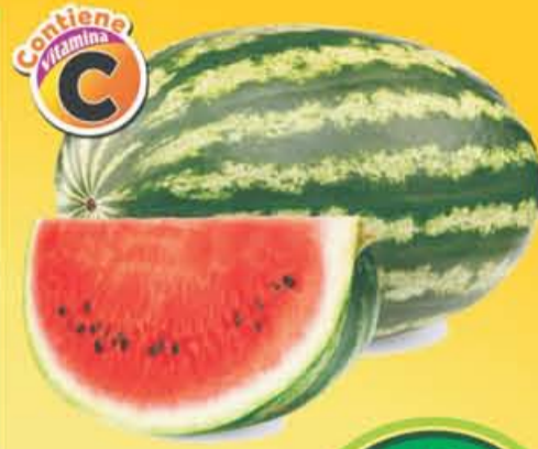
SANDÍA Rayada kilo