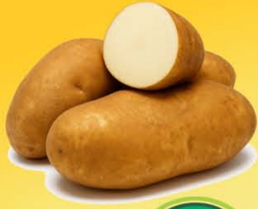
PAPA Russet a granel Kilo