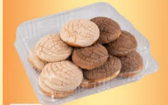
MINI CONCHAS paquete 10 piezas