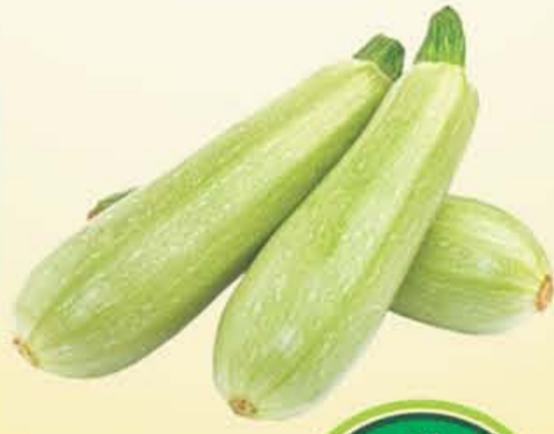
CALABAZA Americana kilo