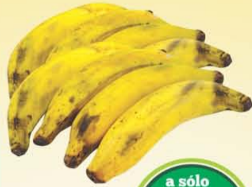
PLÁTANO Macho Kilo