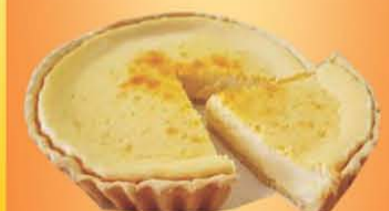
PAY De queso Premium