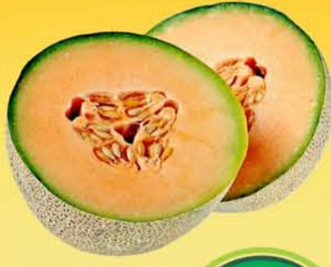
MELÓN Chino kilo