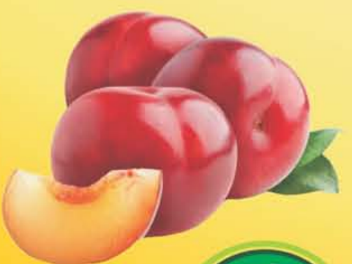
CIRUELA Roja España kilo