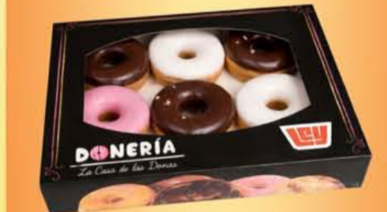
DONAS paquete 6 pz