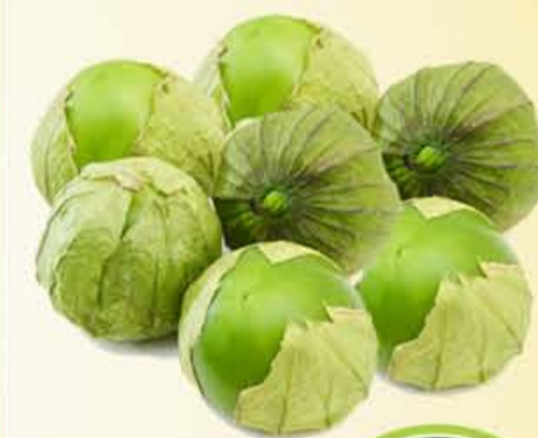
TOMATILLO Con Hoja kilo