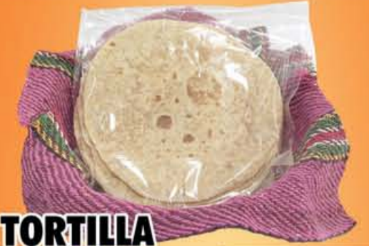
TORTILLA De Harina Paquete 10Pz