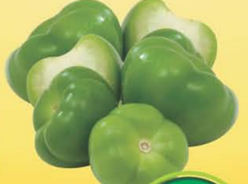
TOMATILLO Limpio kilo