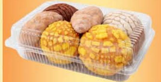
MINI PAN DULCE paquete 10 piezas