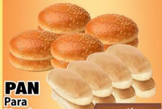
PAN Para Hamburguesa o Hot Dog Bolsa de 8Pz