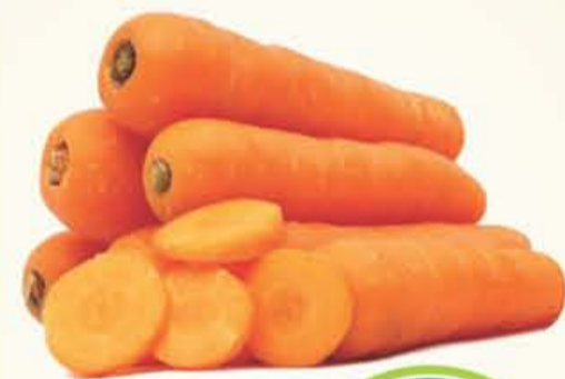
ZANAHORIA A granel kilo