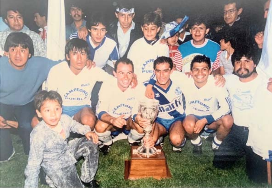
El nacido en Tepic fue campeón con La Franja

De la cancha de la primaria José Octavio Menchaca de Tepic al gol inolvidable ante Italia en el Mundial de Estados Unidos 94