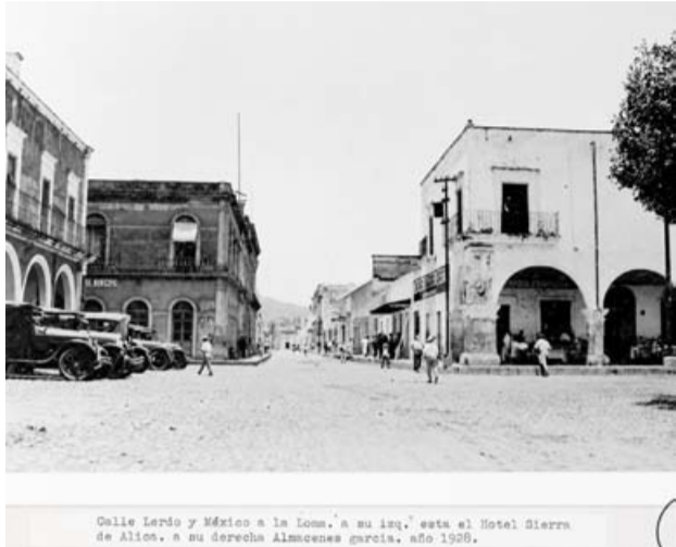
Calle Lerdo y México a la zona. A su izquierda, está el Hotel Sierra de Allier. A su derecha Alameda García. Año 1928.

En 1968, la modernidad tocó a la puerta del primer cuadro de Tepic... y el Portal Andrade tuvo que partir