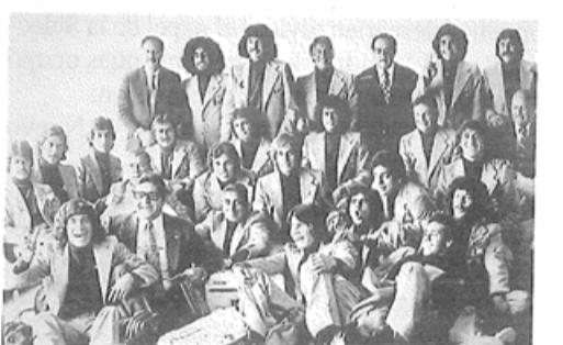
La Selección Mexicana rumbo al Mundial de Argentina.