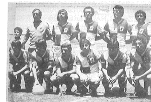
Con el Jalisco.