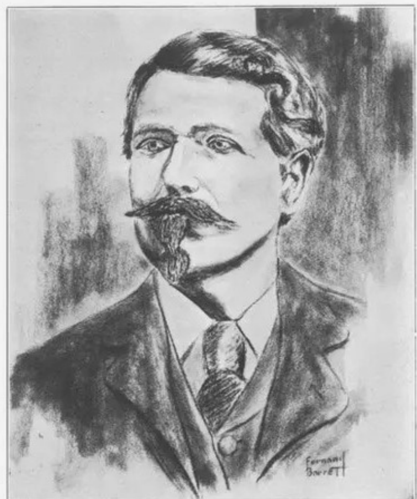
WILLIAM JACKSON SMART INSPIRATION OF FATHERS' DAY

La historia de Sonora Smart Dodd demuestra que el amor y el respeto de una hija hacia su padre deja huella para la posteridad. Quiso reconocer públicamente el esfuerzo de su progenitor y hoy la Universidad de Whitworth crea un archivo documental que cuenta el origen del Día del Padre. Fallece a los 96 años en 1978. Se le rinde homenaje con una placa conmemorativa de bronce instalada cerca del YMCA de Spokane. El título de la placa es: La Madre del Día del Padre.