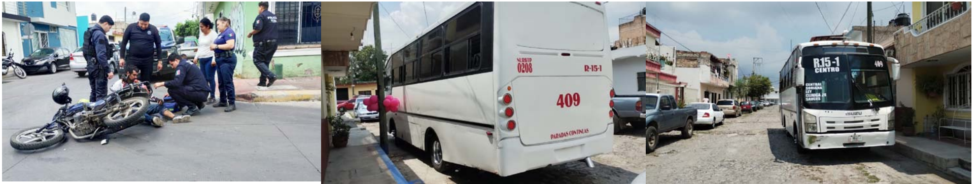
Motociclistas en Tepic