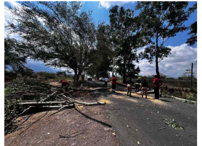
Prevención por lluvias