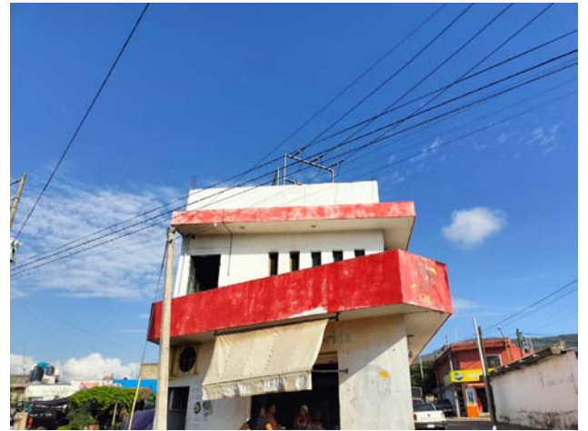
En Vistas de la Cantera