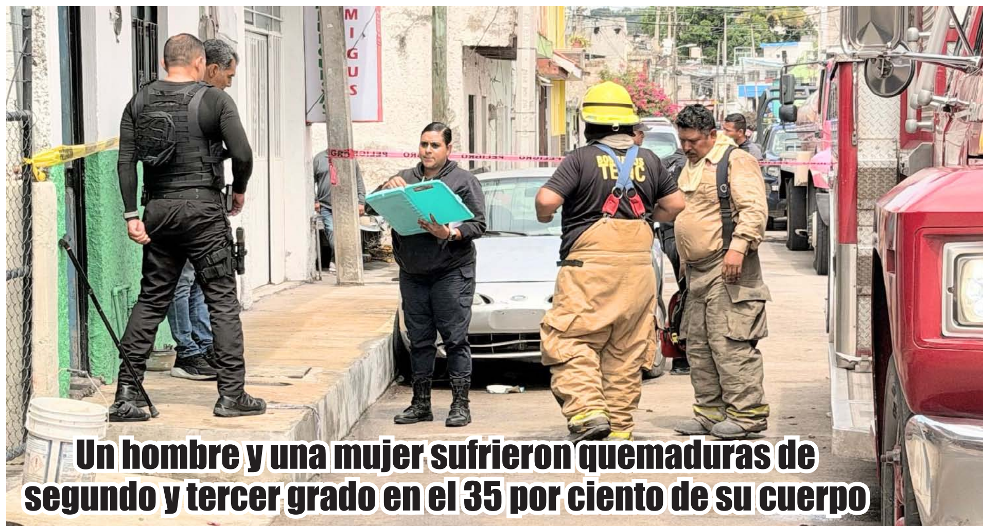
Un hombre y una mujer sufrieron quemaduras de segundo y tercer grado en el 35 por ciento de su cuerpo

Tepic, Nayarit, Lunes 15 de junio de 2026