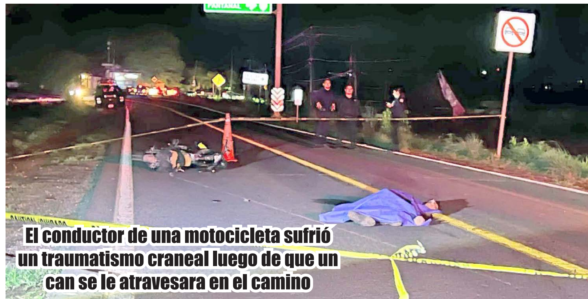
El conductor de una motocicleta sufrió un traumatismo craneal luego de que un can se le atravesara en el camino