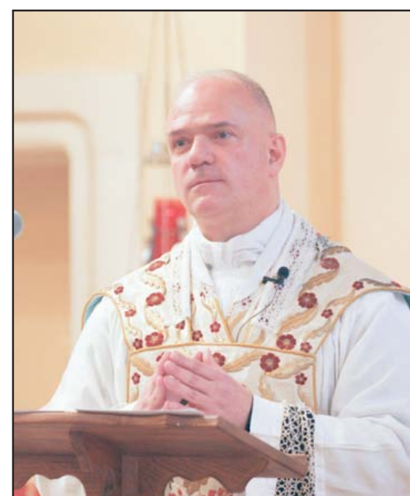
Davide Pagliarani, superior general de la Fraternidad Sacerdotal San Pío X