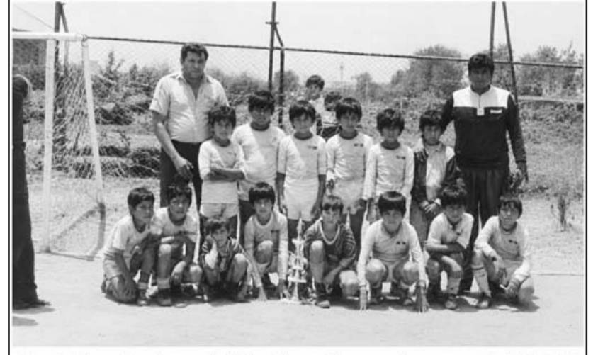
Real Provincia, al término de un torneo del IMSS, 1986.