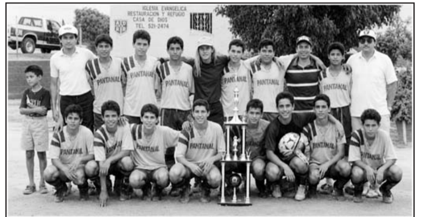
Pantanal Provincia, campeón de la categoría Juvenil Especial, temporada 1992-93.